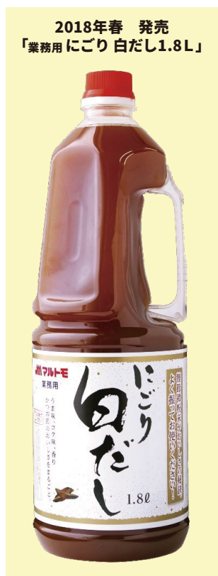
2018年春 発売 「業務用にごり白だし1.8L」