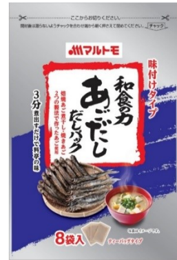
「和食の力あごだし だしパック8g×8袋」