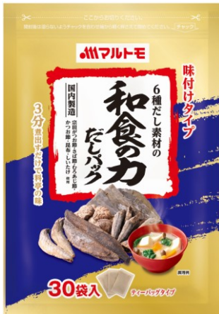
「6種だし素材の和食の力だしパック8g×30袋」