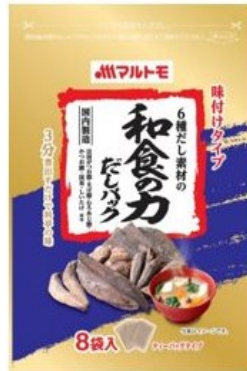
「6種だし素材の和食の力だしパック8g×8袋」