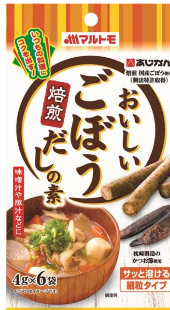
「ごぼうだしの素4g×6袋」